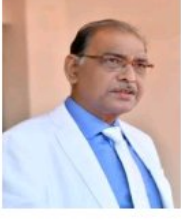
डॉ. केशरी लाल वर्मा कुलपति