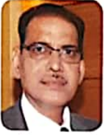
डॉ. केशरी लाल वर्मा कुलपति