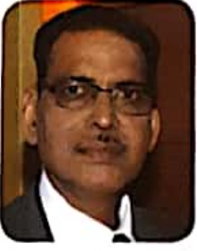
डॉ. केशरी लाल वर्मा कुलपति